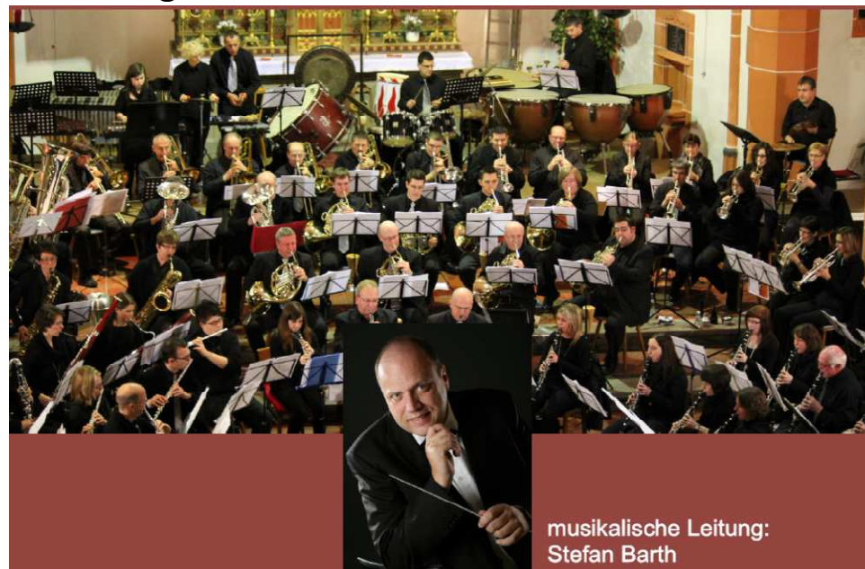
musikalische Leitung: Stefan Barth

Das Orchester des MV „Lyra“ Gusenburg unter der musikalischen Leitung von Dietmar Knippel und das große Orchester des MV Braunshausen